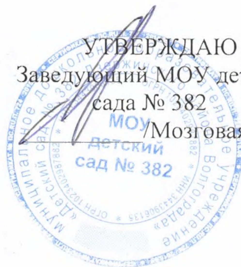
График консультаций педагога дополнительного образования, руководителя кружка «Здоровячок» на 2017-2018 учебный год